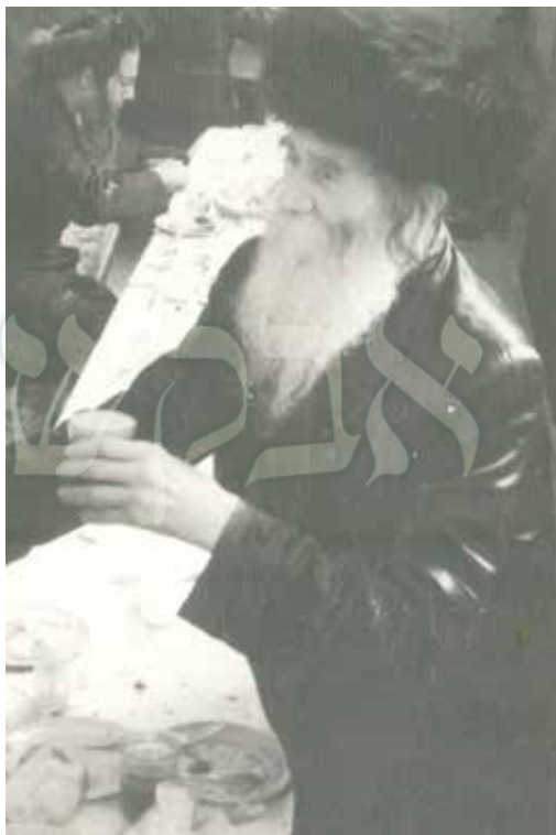
ר' אלחנן ספקטור