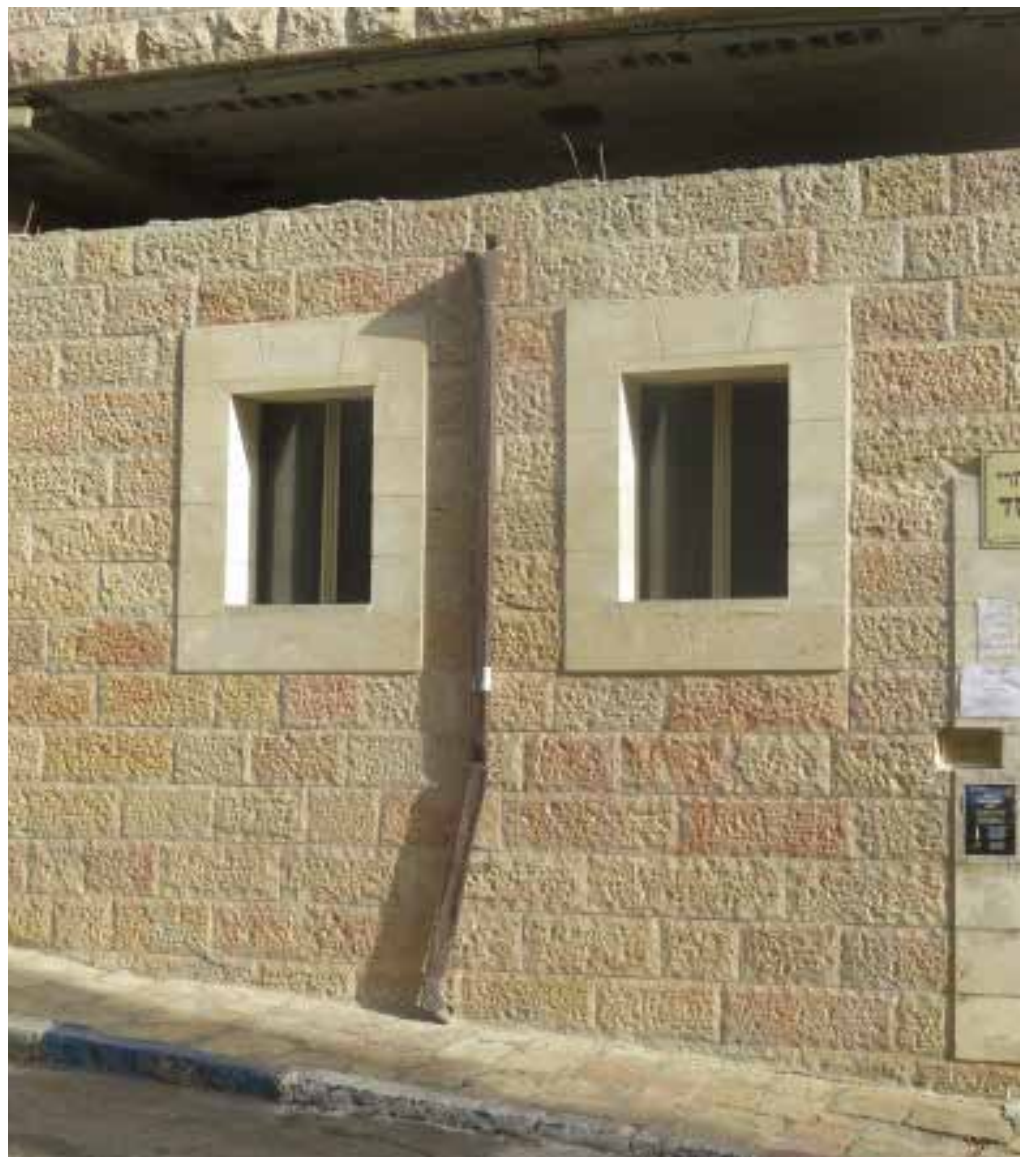
נבנה במסירות נפש. ביהכ"ס ברסלב בשערי חסד (באיכות מכון אלוף התחל)