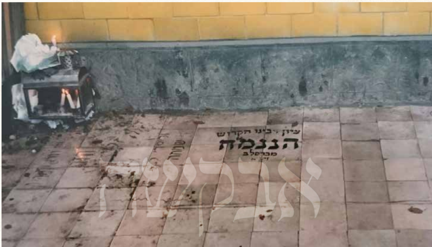
דעם רבי'נס ציון אין יענע יארן

זיינע קינדער טראָן דאָס איז אים גאר שווער אנגעקומען?! ווער איז געווען מסוגל זיך פארצושטעלן מיט זיינע אויגן ווי ר' שמואל דרייט זיך ארום - קלעטערנדיג מיט פארמאכטע אויגן אין די לופט פעלדער וואס רוישן שטענדיג מיט אלע שמוציגע תועבות פון עולם הזה!!?